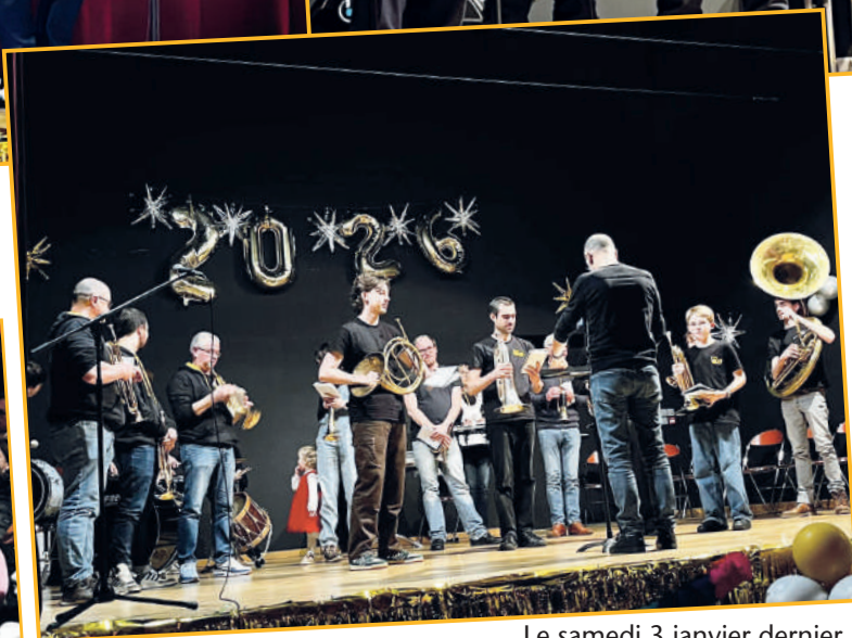
Le samedi 3 janvier dernier, près de 200 Salvatoriens et Salvatoriennes étaient présents à l'occasion des vœux 2026.