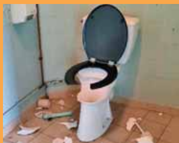
Photo WC public St Sauveur février 2022

Pensons à respecter l'espace public. C'est une perte de temps pour nos agents communaux. C'est de l'argent public gaspillé.