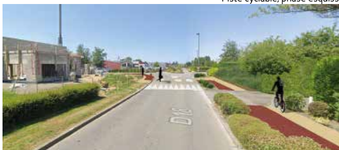
Piste cyclable, phase esquisse