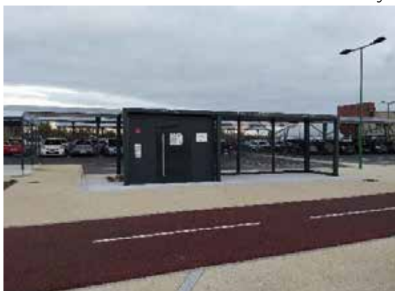
PEM de Romagné