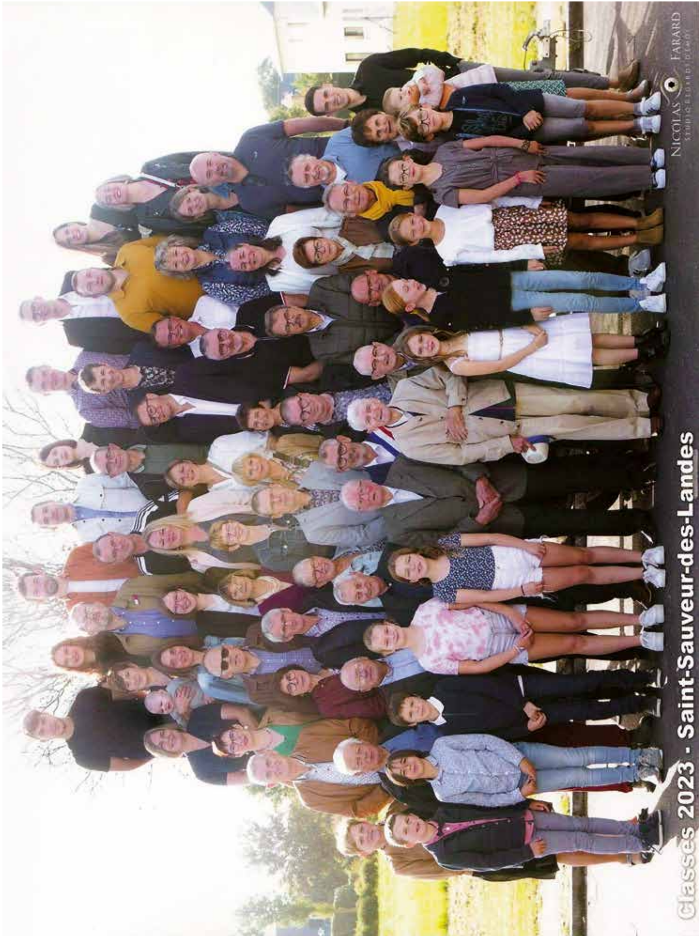
Classes 2023 - Saint-Sauveur-des-Landes