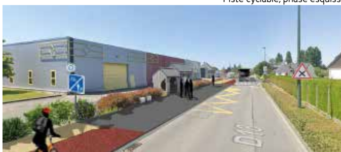
Piste cyclable, phase esquisse