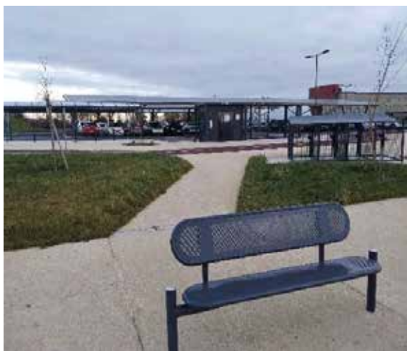
PEM de Romagné

Attention les travaux s'effectueront sous route barrée. Merci de suivre la déviation qui sera mise en place.