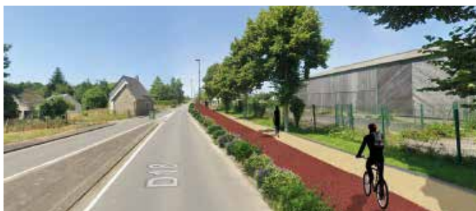
Piste cyclable, phase esquisse